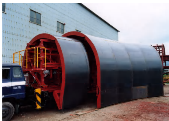
山岳用テレスコピック型枠(タイヤ移動方式)