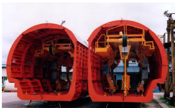
DOT工法用テレフォーム(名古屋地下鉄)