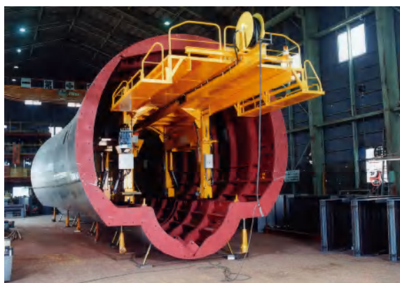
テレフォーム(特殊断面)