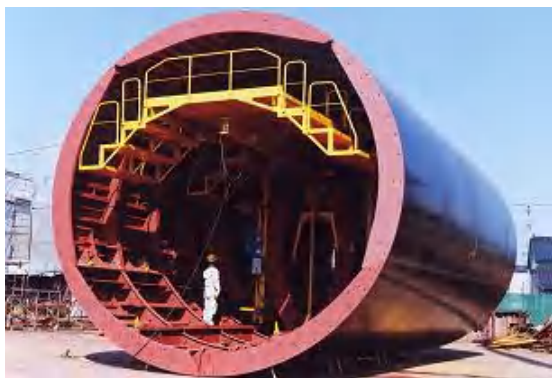
テレフォーム(大断面 D:6.7m×L:12m)