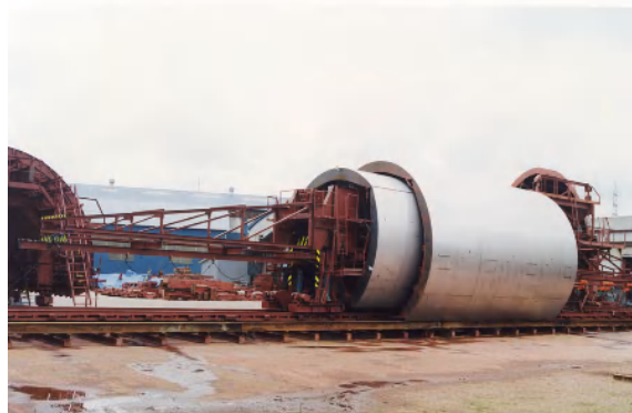
地下鉄用七分巻テレフォーム