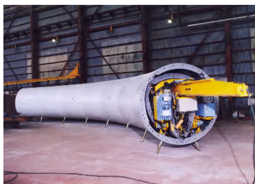
テレフォーム(急曲線 実績最小カーブ 12m)