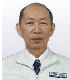
北陸建工株式会社 東京支店